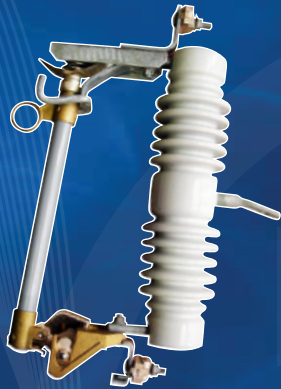
CORTACIUITOS FUSE CUTOIT

FERRETERIA ELÉCTRICA, REDES DISTRIBUCIONES ALTA Y BAJA TENSIÓN