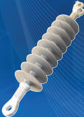
AISLADOR POLIMERICO INSULATOR POLIMER 35KV