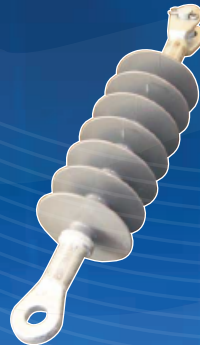
AISLADOR POLIMERICO INSULATOR POLIMER 25KV