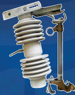
CORTACIUITOS POLIMERICOS FUSE CUTOUT POLYMER